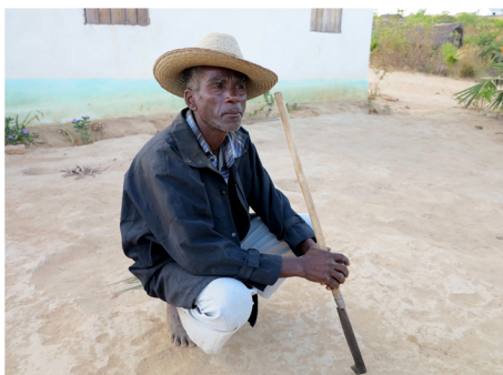
Paysan Sakalava, nord-ouest 2012

Par ailleurs si le projet d'accaparement de 1.3 millions d'hectares de terres cultivables par Daewoo a échoué, il y a quelques années, en